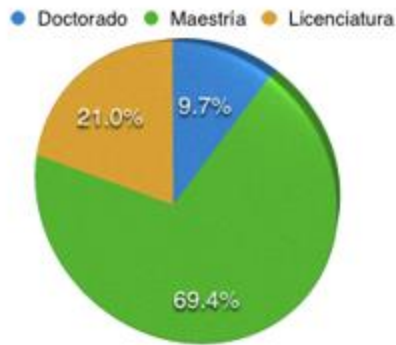
Figura 7 Grado Académico de los Docentes.

Es sabido que como docentes universitarios no es “la docencia” única tarea, sino que implica una serie de funciones además del desarrollo de contenidos de las unidades de aprendizaje. Al consultar al profesorado universitario en qué grado dedica su tiempo a funciones como la docencia, la investigación, la gestión, la tutoría y el desarrollo de proyectos, se observó que la mayoría de los docentes dedican su jornada a las funciones de Docencia (88.7%); en segundo término lo dedican a funciones de Gestión (46.8%) y en tercer lugar prevalecen las funciones de Tutoría (40.3%). De nueva cuenta se observa, que existe una fuerte resistencia por parte de los docentes en atender funciones tanto de elaboración y desarrollo de proyectos, como de Investigación.